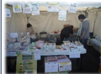
お祭り・販売会出店