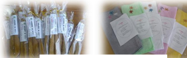
デスク班で竹製品やクロス作成など