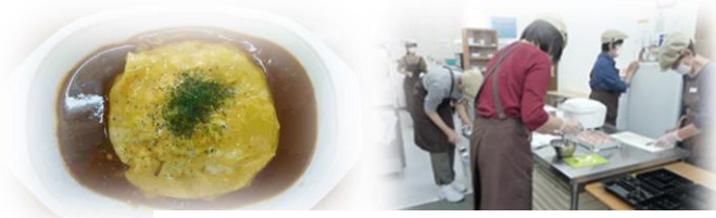
キッチン班でオムライスや弁当作成など