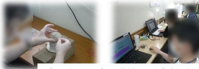
デスク班でエコボール修繕や入力業務など