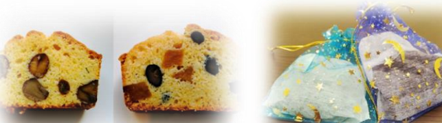
LINKS でケーキやコーヒー消臭袋作りなど