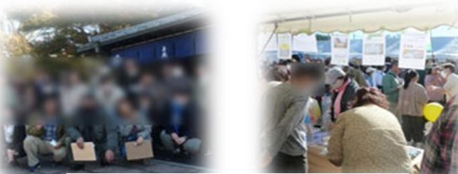
イベント:日帰り旅行やお祭り参加など