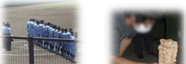
イベント:高校野球観戦やゲーム大会など