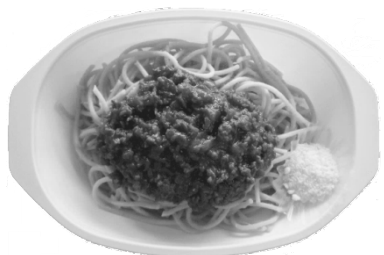
ミートソーススパゲティ

定番カレーのご飯にウコンを混ぜて炊き上げました。 スパイシーなルーにレーズンの甘みが良いアクセント となっています。 エスニックな見た目に食欲をそそられます。