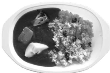
ウコンご飯カレー

7月より新たにレギュラーメニューが追加されました。 どちらもこだわりの一品です、ぜひお店まで足をお運びください。